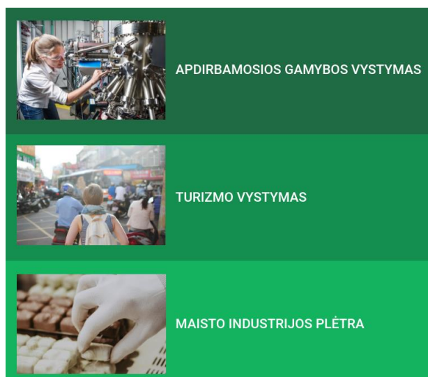
1.7. pav. Alytaus regiono specializacijos kryptys

Nacionalinės regioninės politikos prioritetų iki 2030 metų projekte pateikiamos 2018 m. kovo mėn. Alytaus regiono plėtros taryboje patvirtintos ir šiuo metu su Lietuvos Respublikos vidaus reikalų ministerija derinamos Alytaus regiono specializacijos kryptys (žr. 1.7. paveikslą).