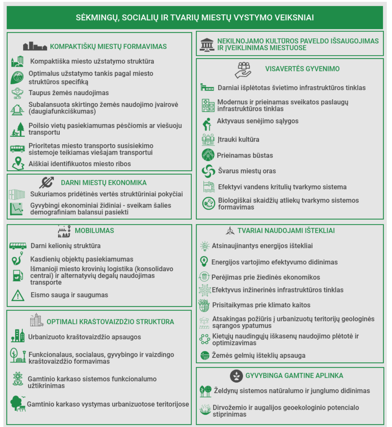
1.8. pav. LRBP įvardinti sėkmingų, socialių ir tvarių miestų vystymo veiksniai