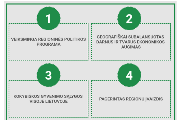
1.6. pav. Nacionalinės regioninės politikos prioritetų iki 2030 metų projektas

uždavinius, nacionalinės regioninės politikos įgyvendinimą ir finansavimą, teritorijas, kuriose įgyvendinama nacionalinė regioninė politika, regioninės plėtros planavimo dokumentų rengimą ir tvirtinimą, taip pat nacionalinę regioninę politiką įgyvendinančius subjektus ir jų įgaliojimus. Įstatyme nurodomas Nacionalinės regioninės politikos tikslas – mažinti socialinius ir ekonominius skirtumus tarp regionų ir pačiuose regionuose, skatinti visoje valstybės teritorijoje tolygią ir tvarią plėtrą. Vadovaujantis Įstatymo 12 straipsnio 1 punktu, yra parengtas Nacionalinės regioninės politikos prioritetų iki 2030 metų projektas, kuriame suformuoti 4 prioritetai.