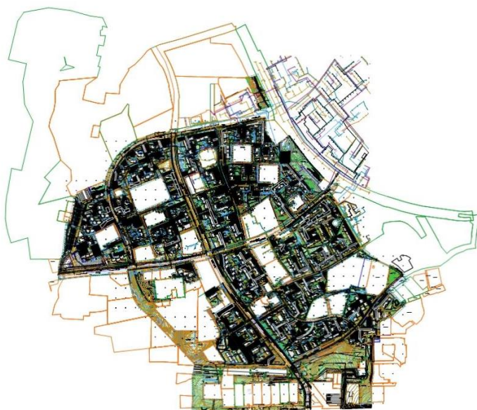
1.2 Pav. Teritorijos, esančios tarp Jazminių, Aukštakalnio, Santaikos, Kepyklos, Topolių, Naujosios gatvių, detaliojo plano, patvirtinto 2014-12-17 Alytaus miesto savivaldybės administracijos direktoriaus įsakymu Nr. DV-891, T00074401 pagrindinis brėžinys

Detaliojo plano T00074401 sprendiniais buvo suformuoti žemės sklypai kvartaluose esančių daugiabučių gyvenamųjų namų, kitos paskirties pastatų bei inžinerinių statinių, želdynų eksploatavimui, nustatyti žemės sklypų naudojimo reglamentai, suplanuotos įvažiavimų, servitutų bei automobilių stovėjimo aikštelių vietos.