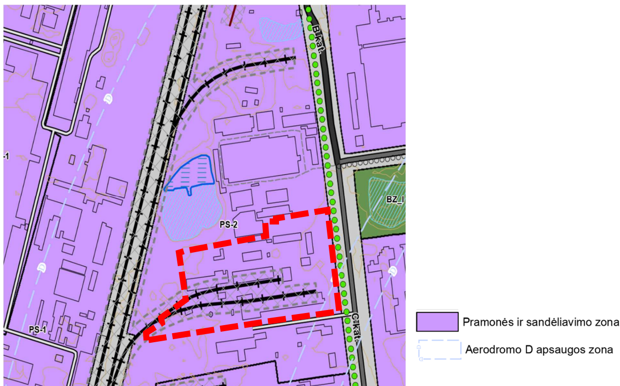
2 pav. Iškarpa iš Alytaus miesto bendrojo plano keitimo koregavimo Pagrindinio brėžinio.

Žemės sklypas adresu Alytus, Pramonės g. 25 (kadastro Nr. 1101/0001:50, unikalus Nr. 1101-0001-0050) (toliau – Žemės sklypas) yra Alytaus miesto savivaldybės teritorijos šiaurinėje dalyje esančioje pramonės ir sandėliavimo zonoje. Žemės sklypo, kurio plotas 8.6487 ha, esama paskirtis – kita, žemės naudojimo būdas – pramonės ir sandėliavimo objektų teritorijos. Žemės sklype veikia AB „Kauno grūdai“. Žemės sklype vykdoma veikla atitinka teritorijos vystymą, numatytą Alytaus miesto savivaldybės bendrojo plano sprendiniams (su vėlesniais pakeitimais).