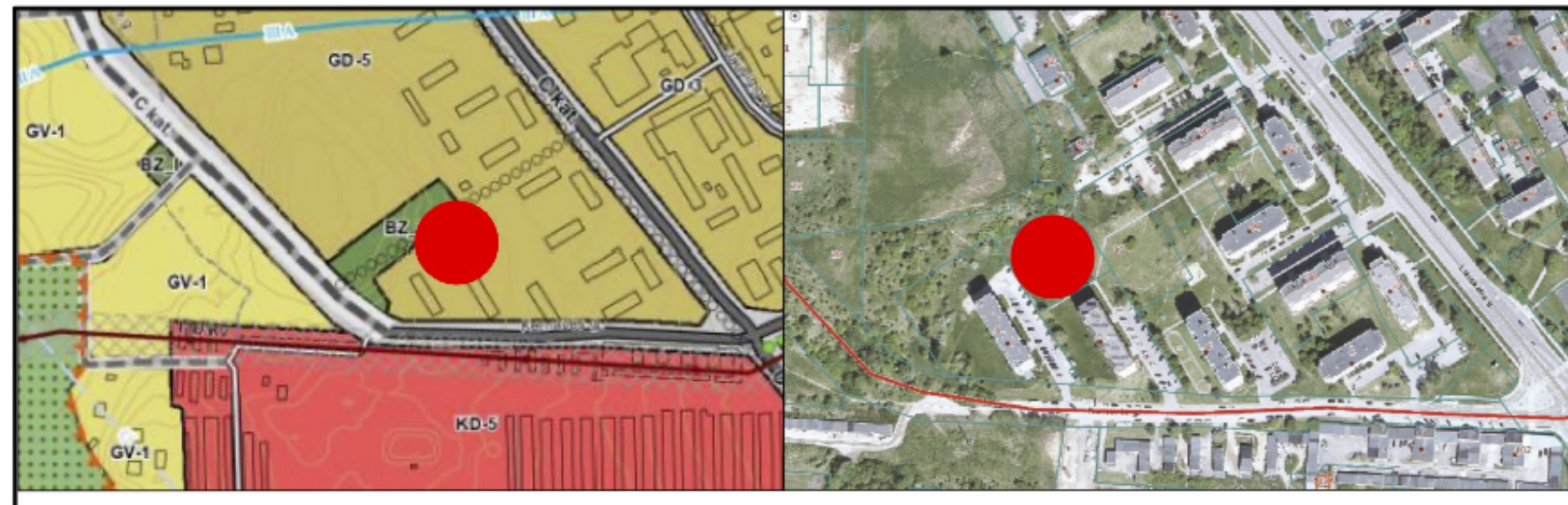
ALYTAUS M. BENDROJO PLANO KEITIMO KOREGAVIMO IŠTRAUKA REGIA.LT IŠTRAUKA