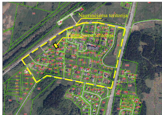
REGIA žemėlapis ištrauka