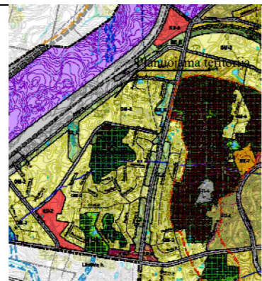
ALYTAUS MIESTO BENDRASIS PLANAS (keitimas)