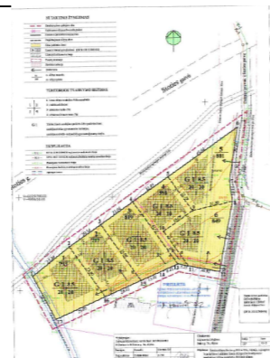
KOREGUOJAMAS DETALUSIS PLANAS