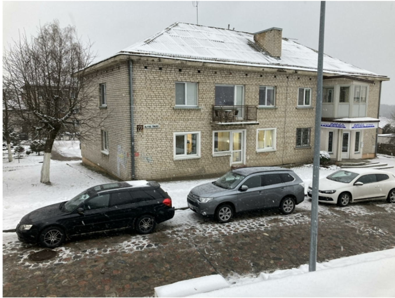
Daugiabutis pastatas Alyvų takas 22