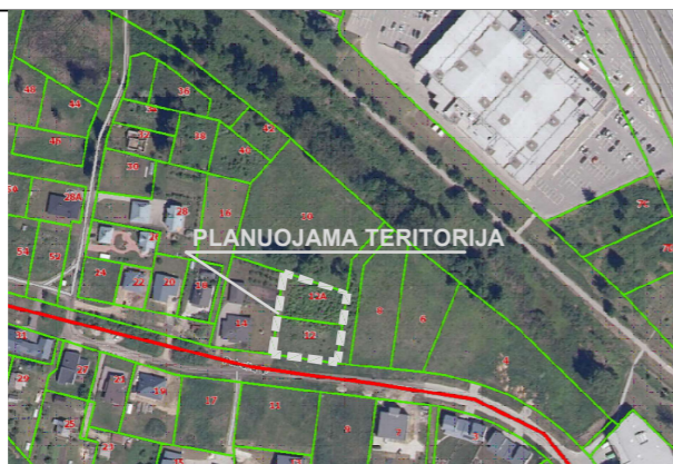
REGIA ŽEMĖLAPIO IŠTRAUKA