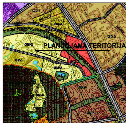
ALYTAUS MIESTO BENDRASIS PLANAS (keitymas)