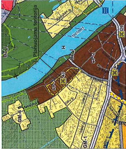
Alytaus m. bendrasis planas