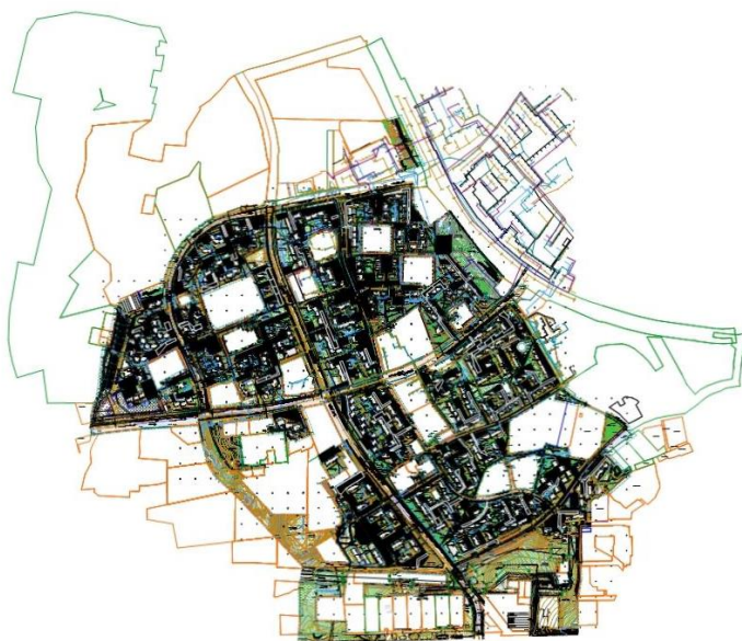
1.2 Pav. Teritorijos, esančios tarp Jazminių, Aukštakalnio, Santaikos, Kepyklos, Topolių, Naujosios gatvių, detaliojo plano, patvirtinto 2014-12-17 Alytaus miesto savivaldybės administracijos direktoriaus įsakymu Nr. DV-891, T00074401 pagrindinis brėžinys

Detaliojo plano T00074401 sprendiniais buvo suformuoti žemės sklypai kvartaluose esančių daugiabučių gyvenamųjų namų, kitos paskirties pastatų bei inžinerinių statinių, želdynų eksploatavimui, nustatyti žemės sklypų naudojimo reglamentai, suplanuotos įvažiavimų, servitutų bei automobilių stovėjimo aikštelių vietos.