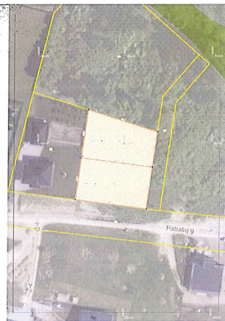
Žemės sklypų formavimo, pertvarkymo projektas