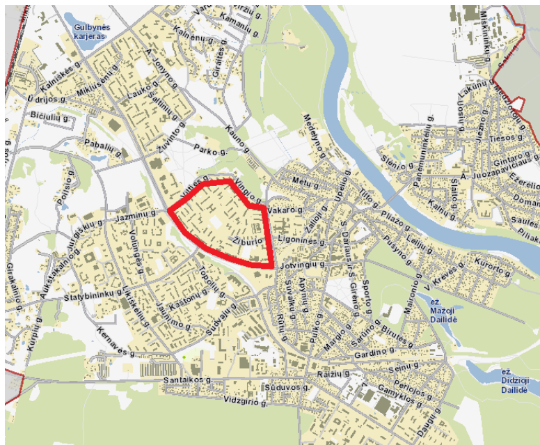
1.1 pav. Situacijos schema

Teritorijų planavimo dokumentas rengiamas LR teritorijų planavimo dokumentų rengimo ir teritorijų planavimo proceso valstybinės priežiūros informacinėje sistemoje (TPDRIS) TPD Nr. K-VT-11-20-613.