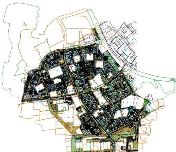
1.2 Pav. Teritorijos, esančios tarp Jazminių, Aukštakalnio, Santaikos, Kepyklos, Topolių, Naujosios gatvių, detaliojo plano, patvirtinto 2014-12-17 Alytaus miesto savivaldybės administracijos direktoriaus įsakymu Nr. DV-891, T00074401 pagrindinis brėžinys

Detaliojo plano T00074401 sprendiniais buvo suformuoti žemės sklypai kvartaluose esančių daugiabučių gyvenamųjų namų, kitos paskirties pastatų bei inžinerinių statinių, želdynų eksploatavimui, nustatyti žemės sklypų naudojimo reglamentai, suplanuotos įvažiavimų, servitutų bei automobilių stovėjimo aikštelių vietos.