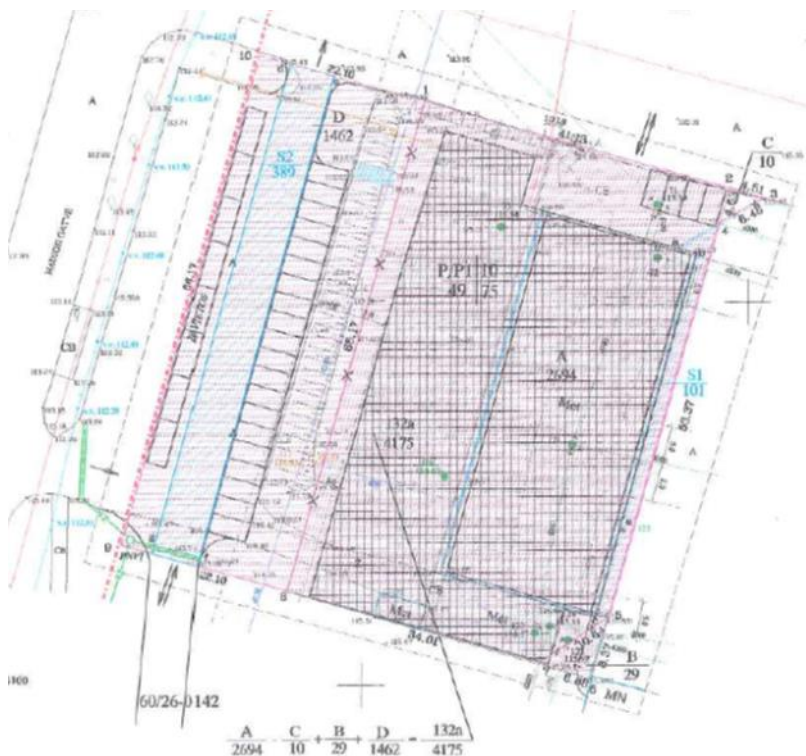
1.2 PAV. KEIČIAMAS DETALUSIS PLANAS, PATVIRTINTAS 2008-07-24 ALYTAUS MIESTO SAVIVALDYBĖS TARYBOS SPRENDIMU NR. T-143

Galiojantis detalusis planas (dabar koreguojamas) T0005132 yra patvirtintas Alytaus miesto savivaldybės tarybos 2008-07-24 sprendimu Nr. T-143 „Dėl detaliųjų planų tvirtinimo“. Pagal patvirtinto detaliojo plano sprendinius buvo suformuotas 0,4175 ha ploto žemės sklypas. Nustatytas žemės sklypo naudojimo būdas – pramonės ir sandėliavimo objektų teritorijos, naudojimo pobūdis – pramonės ir sandėliavimo įmonių statybos; pastatų aukštis – iki 10 metrų; užstatymo tankumas iki 49 %; užstatymo intensyvumas – 0,75.