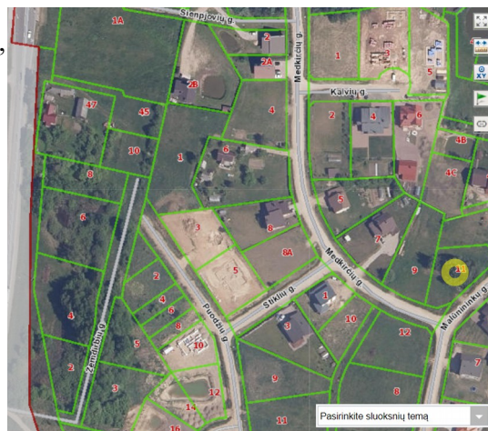
Itrauka iš REGIA žemėlapio

Žemės sklypo Nr. 8 (unik. Nr. 4400-1860-1640, kadastr. Nr. 1101/0002:0132) pavadinimas – Šienpjovių gatvė - pakeistas į Žemdirbių gatvė (2018 -06-28 Alytaus m. Tarybos sprendimas T-191). Naujas adresas NT registre neregistruotas.