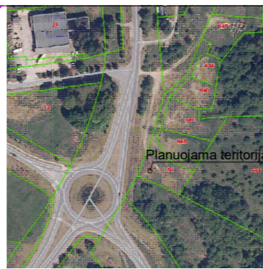
KOREGUOJAMAS DETALUSIS PLANAS