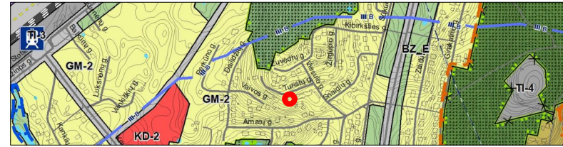
Ištrauka iš Alytaus miesto bendrojo plano