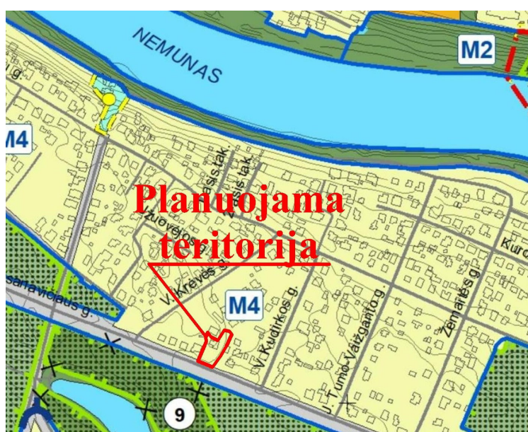
Ištrauka iš Alytaus miesto bendrojo plano keitimo (TPD registro Nr. T00084849) Kraštovaizdžio tvarkymo brėžinio

Pagal Alytaus miesto bendrojo plano keitimo (TPD registro Nr. T00084849) sprendinius planuojamos teritorijos žemės sklypai J. Basanavičiaus g. 3E ir J. Basanavičiaus g. 3B patenka į gamtinio karkaso teritoriją – vietinės svarbos migracinį koridorių. Alytaus miesto bendrojo plano keitimo Aiškinamojo rašto 2 lentelėje „Teritorijos tvarkymo reikalavimai“ bei Kraštovaizdžio tvarkymo brėžinyje yra numatytos gamtinio karkaso teritorijų tvarkymo kryptys. Planuojamai teritorijai taikytina gamtinio karkaso teritorijų tvarkymo kryptis žymima indeksu M4 (urbanizuoto gamtinio karkaso tvarkymo zona).