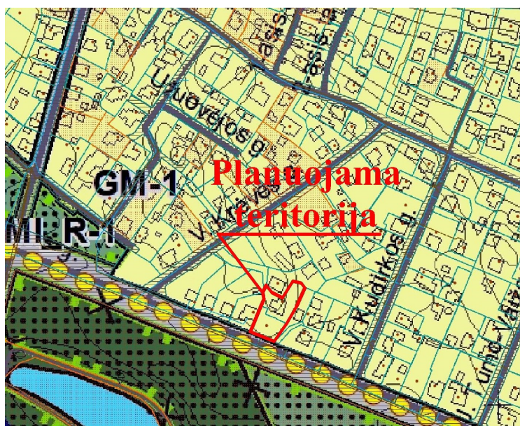
Ištrauka iš Alytaus miesto bendrojo plano keitimo (TPD registro Nr. T00084849) Pagrindinio brėžinio

esamuose ir naujai formuojamuose miesto gyvenamuosiuose kvartaluose. Plėtra realizuojama modernizuojant, konvertuojant, tankinant esamas užstatytas teritorijas ir naujai užstatant neurbanizuotas teritorijas.