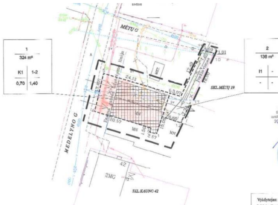
1.1 PAV. KEIČIAMO DETALIOJO PLANO T00006128, PATVIRTINTO 2004-07-01 ALYTAUS MIESTO SAVIVALDYBĖS TARYBOS SPRENDIMU NR. T-131, PAGRINDINIS BRĖŽINYS