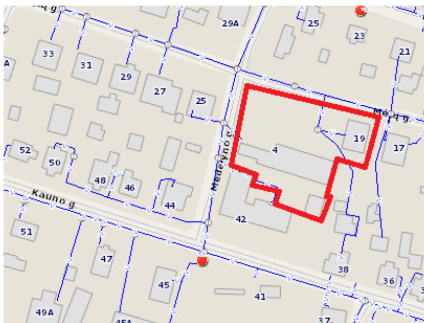
5.1 pav. Gaisrinių hidrantų schema (UAB „Dz9kijos vandenys“ duomenys)

Sprendiniuose numatytos galimybės gaisrų gesinimo ir gelbėjimo automobiliams privažiuoti prie esamų pastatų. Gaisro plitimas į gretimus pastatus ribojamas užtikrinant saugius atstumus tarp pastatų lauko sienų. Konkretūs priešgaisriniai atstumų tarp pastatų reikalavimai ir taikymo sąlygos išdėstyti Gaisrinės saugos pagrindiniuose reikalavimuose (patvirtintuose Priešgaisrinės apsaugos ir gelbėjimo departamento prie Vidaus reikalų ministerijos direktoriaus 2010 m. gruodžio 7 d. įsakymu Nr. 1-338). Artimiausias gaisrinis hidrantas yra Kauno gatvėje, ties Kauno-Medelyno gatvių sankirta. Tai antžeminis gaisrinis hidrantas numeris 73, kurio skersmuo 100. Jis nutolęs nuo planuojamos teritorijos į pietus apie 50 metrų.