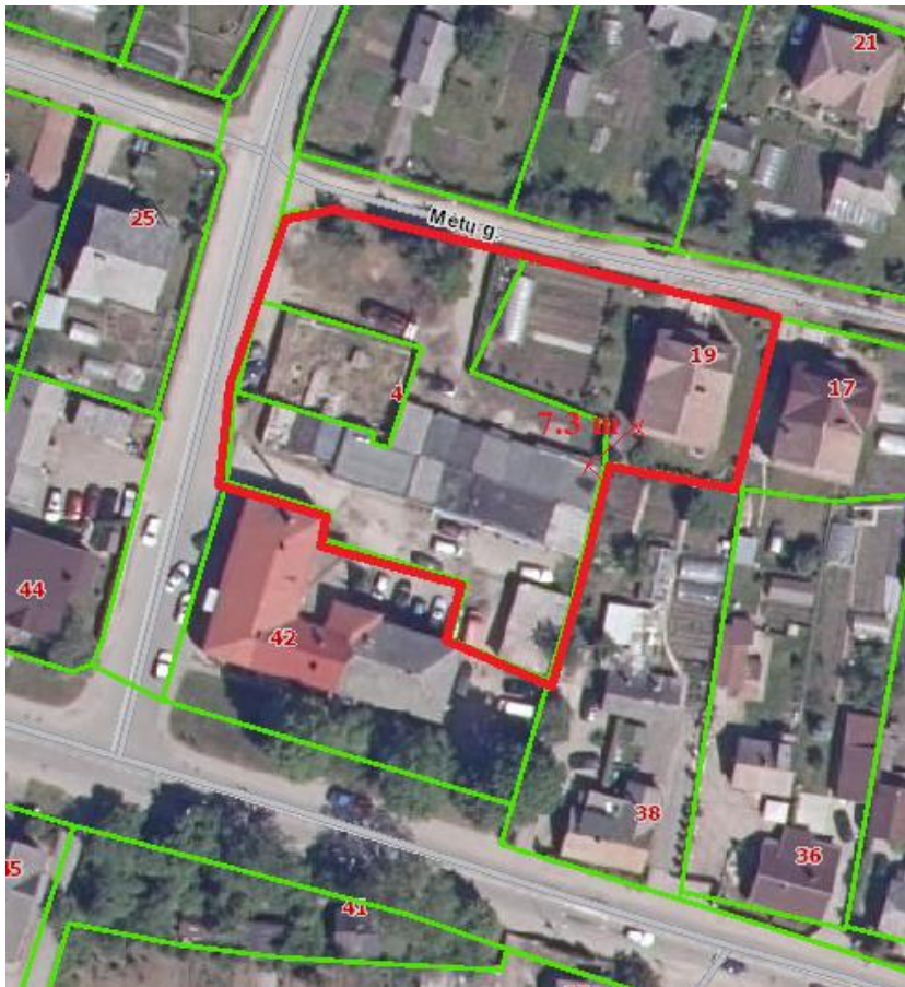
5.1 pav. Situacijos schema. STR reikalaujami atstumai nuo garažų iki vienbučių ir dvibučių gyvenamųjų namų

Pagal STR 2.06.04:2014 „Gatvės ir vietinės reikšmės keliai. Bendrieji reikalavimai“ lentelę Nr. 32 1 nuo uždarojo tipo antžeminių automobilių saugyklų ir garažų, kai automobilių skaičius 5-10 vnt., leistinas atstumas iki gyvenamųjų namų 5 metrai. Pagal STR punktą 123.4. * atstumas matuojamas nuo įvažiavimo / išvažiavimo vartų ir vėdinimo sistemos oro šalinimo angų iki patalpų varstomų langų ir vėdinimo sistemos oro ėmimo angų. Žemės sklypo Nr. 2 šiaurinėje dalyje yra 9 boksai, kurių durys atgręžtos į gyvenamąjį namą, esantį žemės sklype Mėtų g. 19. Mažiausiais atstumais nuo garažo vartų iki esamo namo 7,3 metro. Naujas užstatymas sklype Nr. 3 planuojamas 15 metrų atstumu nuo esamų garažų vartų. Be to tarp garažų ir gyvenamojo namo yra aukšta tujų gyvatvorė. Planuojamo sklypo Nr. 2 pietinėje dalyje esantys garažų boksai, kurių durys nukreiptos į pietus, nuo gretimame sklype Kauno g. 38 esančio gyvenamojo namo nutolę daugiau nei 25 m.