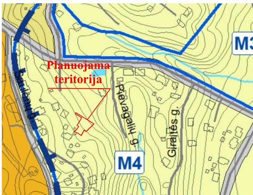
Ištrauka iš Alytaus miesto bendrojo plano keitimo (TPD registro Nr. T00084849) Kraštovaizdžio tvarkymo brėžinio

Pagal Alytaus miesto bendrojo plano keitimo (TPD registro Nr. T00084849) sprendinius planuojamos teritorijos žemės sklypas Vardos g. 50A su įsiterpusiu laisvos valstybinės žemės plotu patenka į gamtinio karkaso teritoriją – vietinės svarbos migracinį koridorių. Alytaus miesto bendrojo plano keitimo Aiškinamojo rašto 2 lentelėje „Teritorijos tvarkymo reikalavimai“ bei Kraštovaizdžio tvarkymo brėžinyje yra numatytos gamtinio karkaso teritorijų tvarkymo kryptys. Planuojamai teritorijai taikytina gamtinio karkaso teritorijų tvarkymo kryptis žymima indeksu M4 (urbanizuoto gamtinio karkaso tvarkymo zona).