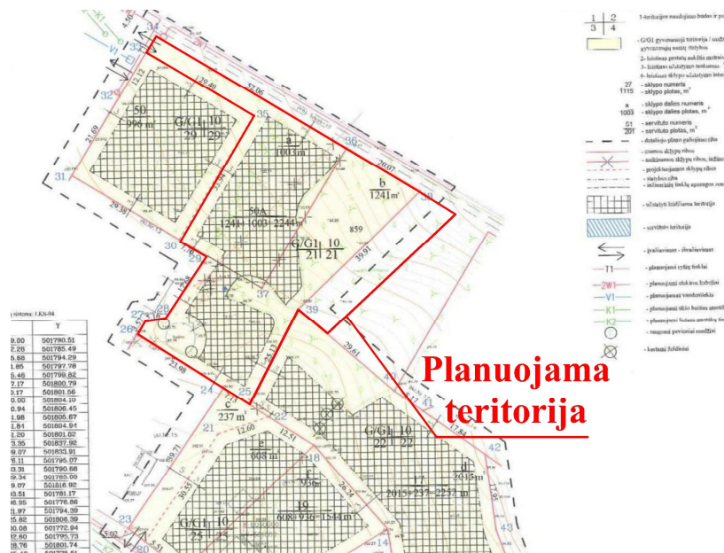
Ištrauka iš Žemės sklypų Saulėnų g.17, Saulėnų g. 19, Saulėnų g. 23, Saulėnų g. 25, Saulėnų g. 25A, Saulėnų g. 27, Vardos g. 50, Vardos g. 50A, Alytuje, tarpusavio ribų keitimo bei tvarkymo ir naudojimo režimo nustatymo detaliojo plano (TPD, reg. Nr. T00006225)

Pagal galiojančio Alytaus miesto bendrojo plano keitimo (TPD registro Nr. T00084849) sprendinius planuojama teritorija patenka į gyvenamąją mažo užstatymo intensyvumo zoną (teritoriją pažymėtą indeksu GM-1), kurioje maksimalus užstatymo intensyvumas gyvenamajai teritorijai yra 0,4, didžiausias leistinas aukštų skaičius/aukštis –2 a./10 m, negyvenamajai teritorijai maksimalus užstatymo intensyvumas yra 0,8, didžiausias leistinas aukštų skaičius/aukštis –2 a./10 m. Bendrajame plane numatytos mažo užstatymo intensyvumo teritorijos – tai dominuojančio vienbučio / dviučio gyvenamojo užstatymo teritorijos kartu su socialinių, visuomeninių ir paslaugų objektų infrastruktūra esamuose ir naujai formuojamuose miesto gyvenamuosiuose kvartaluose. Plėtra realizuojama modernizuojant, konvertuojant, tankinant esamas užstatytas teritorijas ir naujai užstatant neurbanizuotas teritorijas.