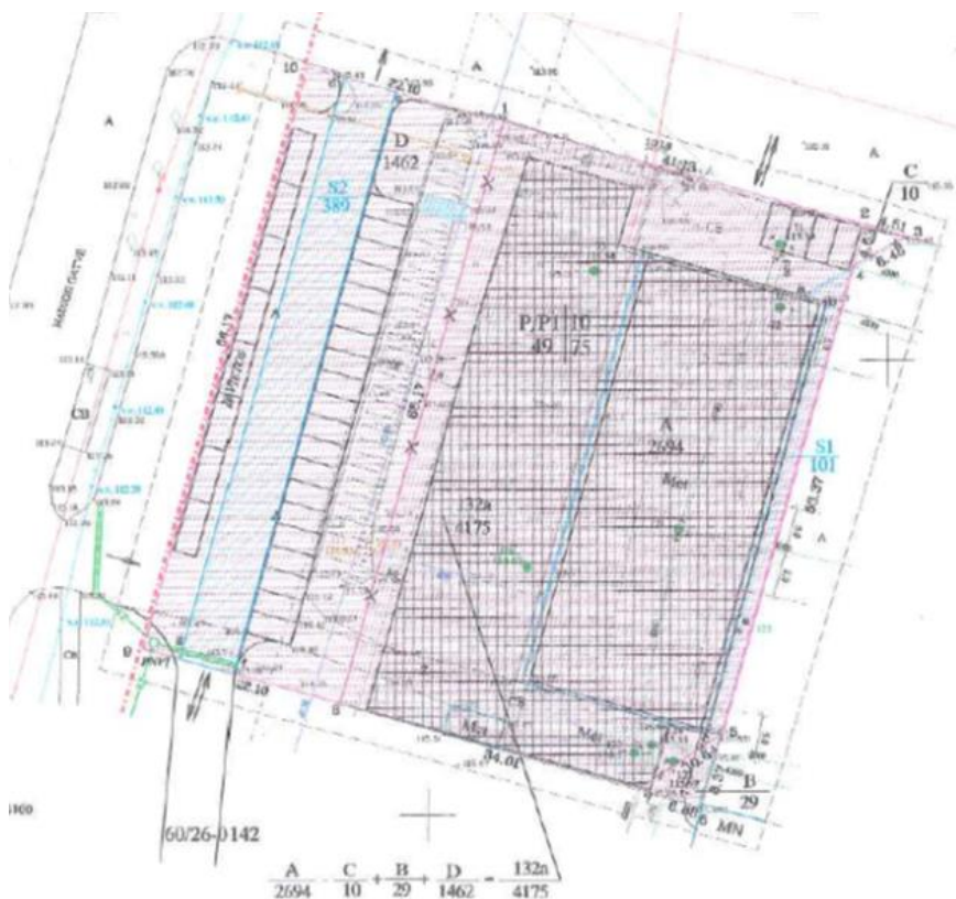
1.2 PAV. KEIČIAMAS DETALUSIS PLANAS, PATVIRTINTAS 2008-07-24 ALYTAUS MIESTO SAVIVALDYBĖS TARYBOS SPRENDIMU NR. T-143

Galiojantis detalusis planas (dabar koreguojamas) T0005132 yra patvirtintas Alytaus miesto savivaldybės tarybos 2008-07-24 sprendimu Nr. T-143 „Dėl detaliųjų planų tvirtinimo“. Pagal patvirtinto detaliojo plano sprendinius buvo suformuotas 0,4175 ha ploto žemės sklypas. Nustatytas žemės sklypo naudojimo būdas – pramonės ir sandėliavimo objektų teritorijos, naudojimo pobūdis – pramonės ir sandėliavimo įmonių statybos; pastatų aukštis – iki 10 metrų; užstatymo tankumas iki 49 %; užstatymo intensyvumas – 0,75.