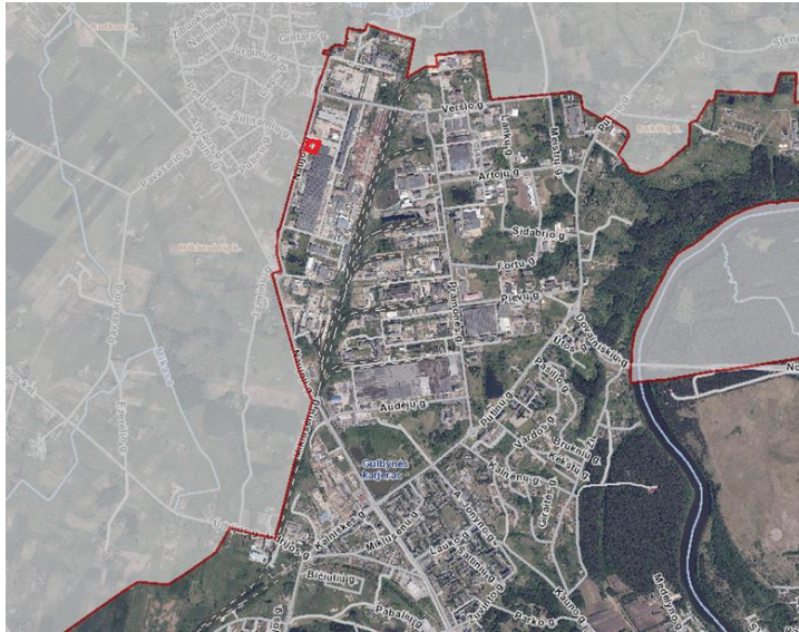
1.1 PAV. SITUACIJOS SCHEMA

Teritorijų planavimo dokumentas rengiamas LR teritorijų planavimo dokumentų rengimo ir teritorijų planavimo proceso valstybinės priežiūros informacinėje sistemoje (TPDRIS) TPD Nr. K-VT-11-17-591