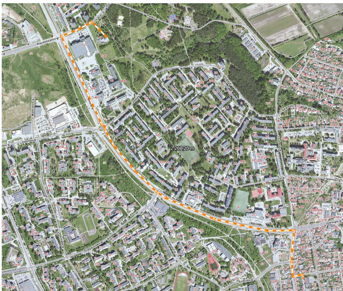
Ištrauka iš Alytus miesto žemėlapiu su atstumu iki priešgaisrinės tarnybos 1-osios komandos (2,27 km) Suvalkų g. 34