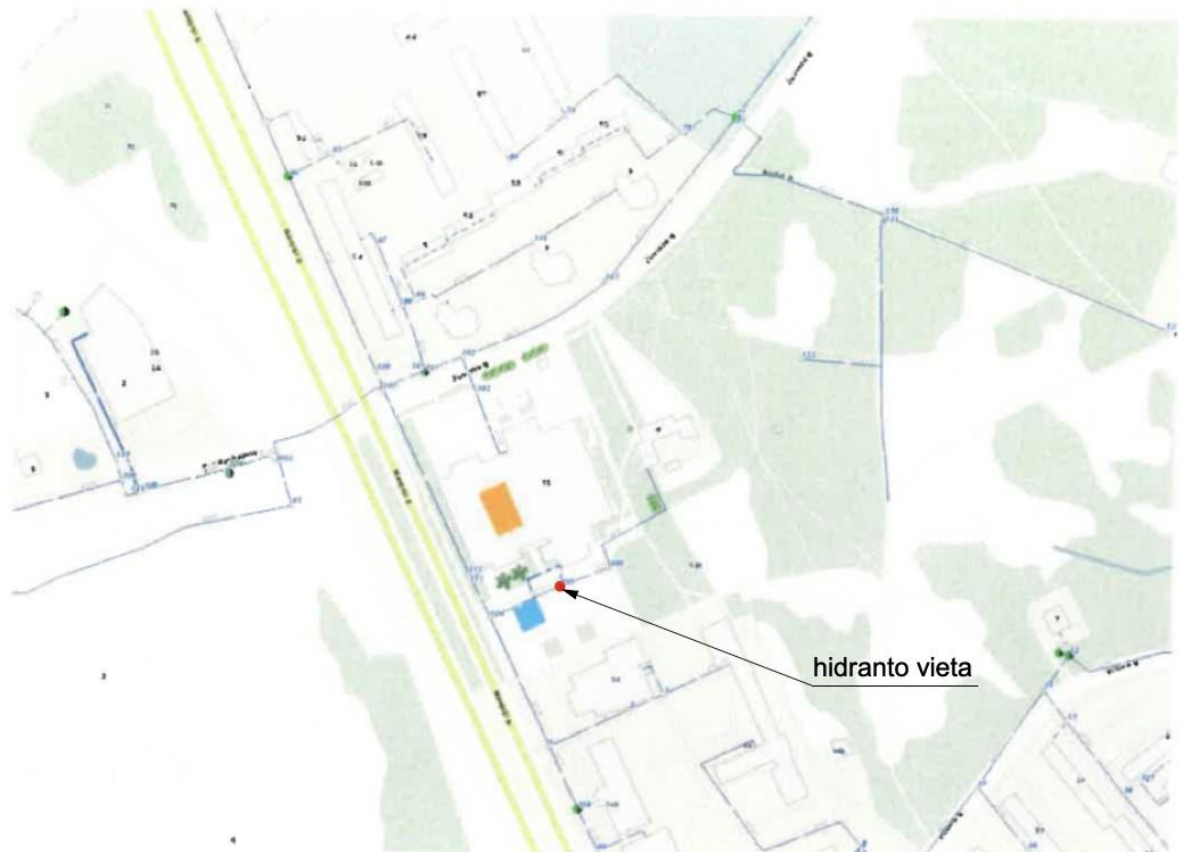
Ištrauka su hidrantų išdėstymu

Gaisrų gesinimui vandens paėmimas yra galimas iš hidranto, esančio ~190 m atstumu nuo tolimiausio pastato taško.