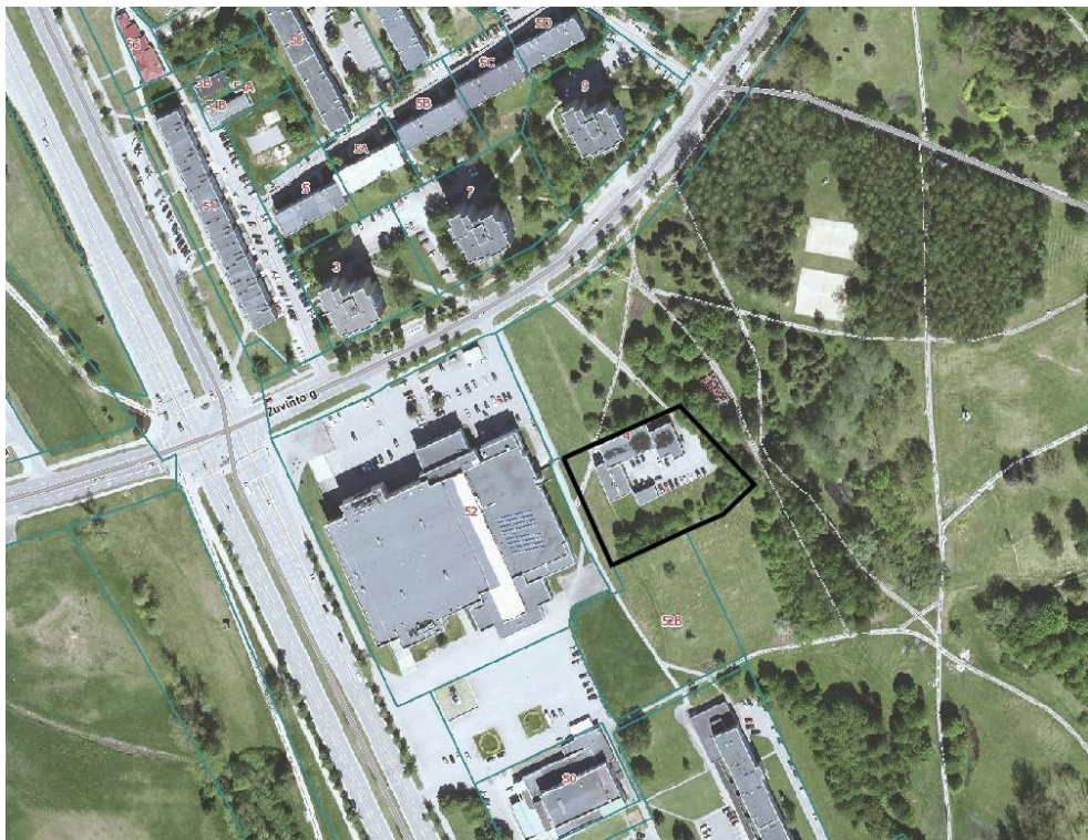
Ištrauka iš regia.lt