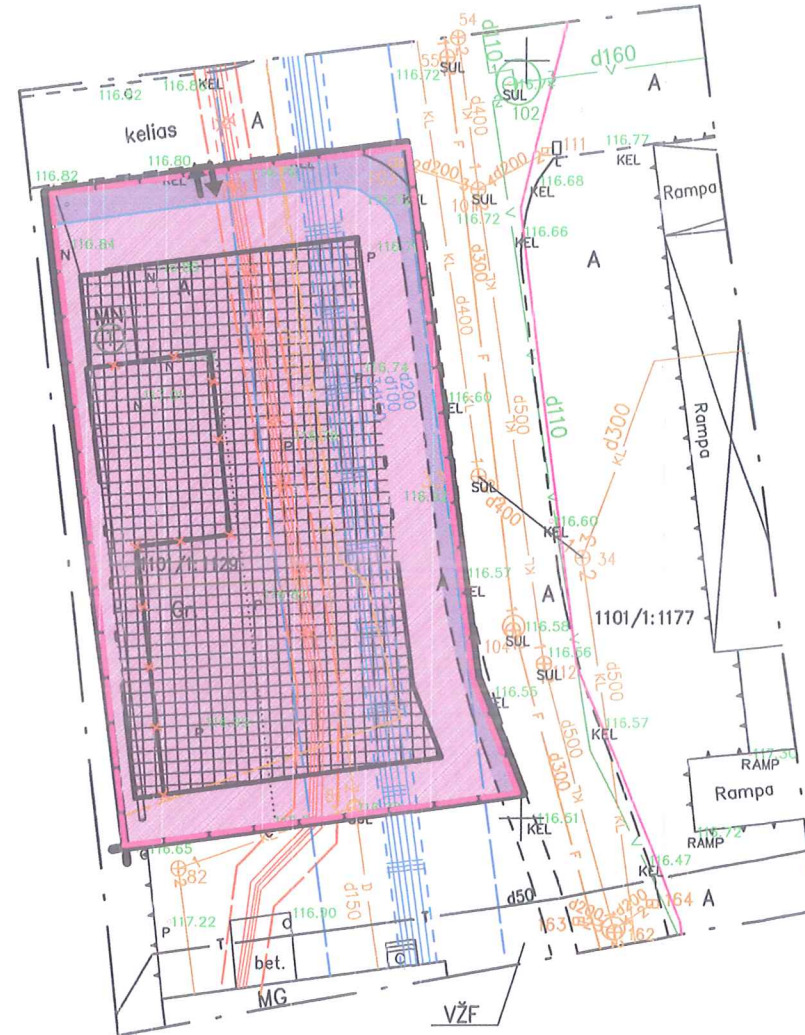
Topografijos galiojimo riba