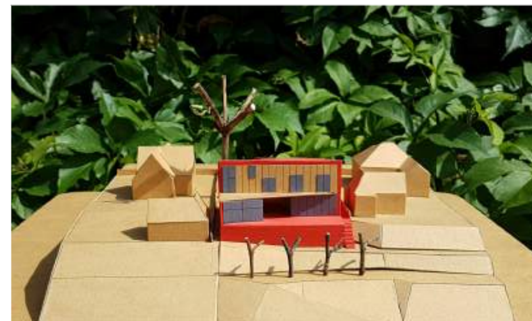
VAIZDAS NUO NEMUNO, IŠ ŠIAURĖS