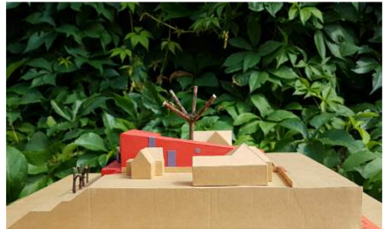
VAIZDAS IŠILGAI NEMUNO ŠLAITO, IŠ VAKARŲ