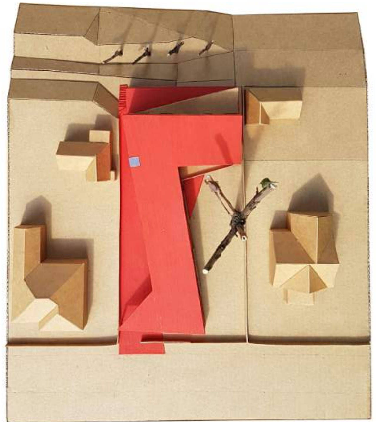
VAIZDAS IŠ SAKALO SKRYDŽIO