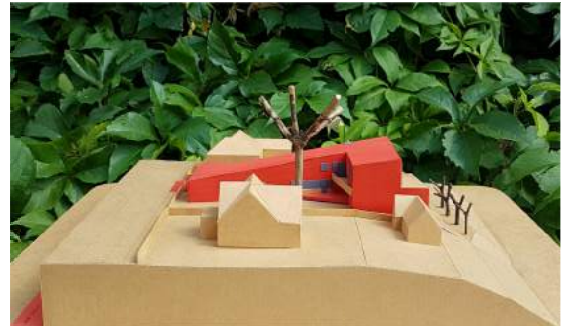
VAIZDAS IŠILGAI NEMUNO ŠLAITO, IŠ RYTŲ