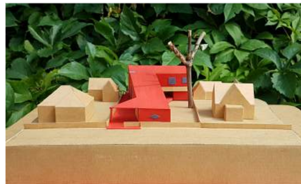
VAIZDAS NUO LELIJŲ GATVĖS, IŠ PIETŲ